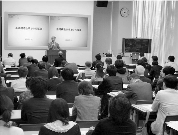
特別講演は、新しい公共の制度を創出する、市民参画の新たな「公共福祉」を創造して、こうして5月7日午後、東京・芝浦のキャンパスイノベーションセンターで「公共福祉」のシンポジウムが開催された。主催は東京基督教大学と公共福祉研究センター。シンポは今年4月、東京基督教大学と公共福祉研究センターの創設記念シンポとして企画した。

公的制度だけに頼らない、市民参画の新たな「公共福祉」を創造して、こうして5月7日午後、東京・芝浦のキャンパスイノベーションセンターで「公共福祉」のシンポジウムが開催された。主催は東京基督教大学と公共福祉研究センター。シンポは今年4月、東京基督教大学と公共福祉研究センターの創設記念シンポとして企画した。