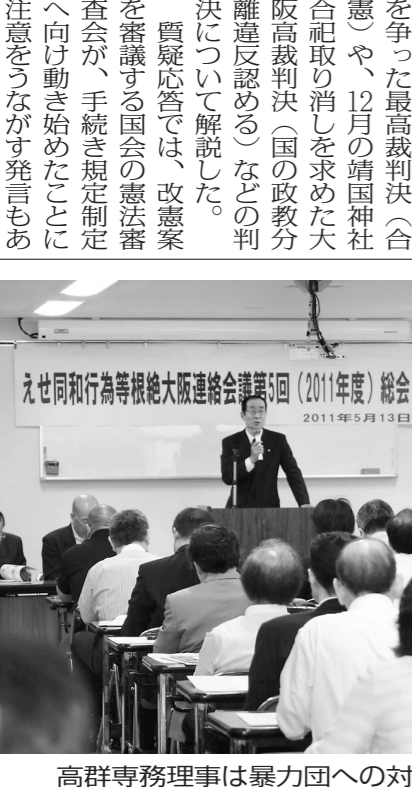
高群事務局長は暴力団への対応を述べた。

「政教分離の侵害を監視する全国会議」(政教分離の会)が報告した。西川事務局長は、政教分離の現状について報告し、今後の課題を指摘した。