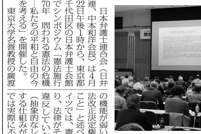
緊急事態条項、「軍学共同」に危機感表す。5月29日、永田町憲政記念館で「平成29年度新しい憲法制定する推進大会」が開催された。

被爆者家族の話をして認定しており、このほか北朝鮮による拉致の可能性があると思われる事実を明らかにする。再発防止と家族の面会及び帰国への便宜の保障を約束した。