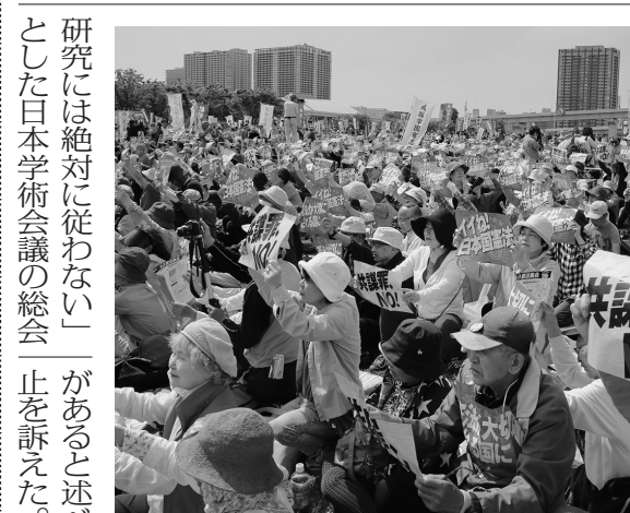
5・3憲法集會実行委員会主催の「憲法の大切さ」集会。5月3日、東京・有明の東京臨海広域防災公園で開かれた。

5・3憲法集會実行委員会が5月3日午後1時から、東京・有明の東京臨海広域防災公園で「施行70年 いよいよ日本国憲法―平和と自由のちと人権を―」5・3憲法集會を開催した。プレコサートの後、開会。「トーク」として、ファッション評論家のピーコ氏、世界平和アムール七人委員会委員の池内氏、劇作家・演出家の坂手洋二氏、映画監督の山田火砂子氏がスピーチを行った。