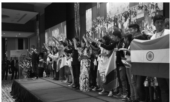
開会式では、子どもたちが元気よく発表を行った

「子ども」のための宗教者ネットワーク(GNRC=Global Network of Religions for Children)は、子どもの権利と課題に取り組む世界規模の諸宗教ネットワーク。