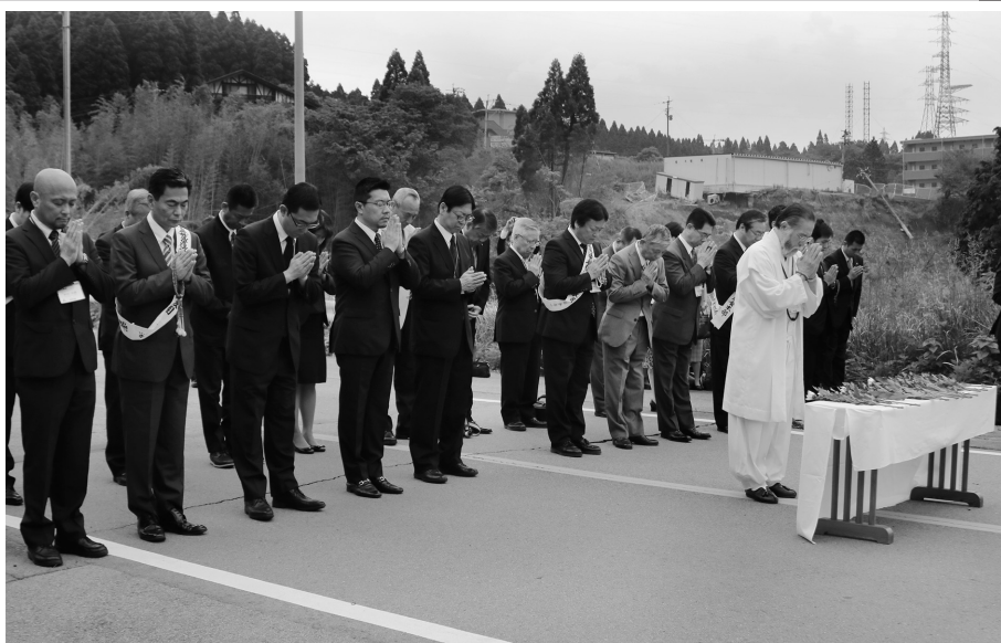
阿蘇大橋の崩落現場で犠牲者の慰霊と早期復興を祈願する(24日)

新宗連は、東日本大震災(2011年3月11日)から1年が経過した。被災地を忘れることなく、復興を祈願していくことを目的として被災被災地を復興祈念集会を開催してきた。