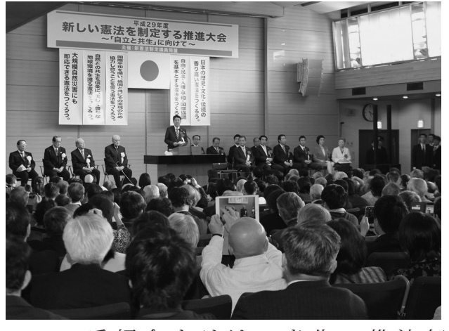
新憲法制定議員同盟(中)午後4時から、東京・永田町憲政記念館で「平成29年度新しい憲法制定する推進大会」を開催。曾根康弘会長(左)は5月1日、町憲政記念館で「平成29年度新しい憲法制定する推進大会」を開催した。

新憲法制定議員同盟(中)午後4時から、東京・永田町憲政記念館で「平成29年度新しい憲法制定する推進大会」を開催した。曾根康弘会長(左)は5月1日、町憲政記念館で「平成29年度新しい憲法制定する推進大会」を開催した。